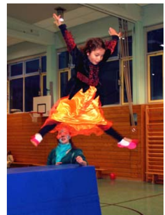
Fasching in der OMG-Schulturnhalle: Die springende Maus ist