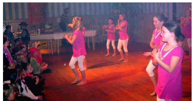
Im Gasthof zur Post in Aufkirchen ↑↑