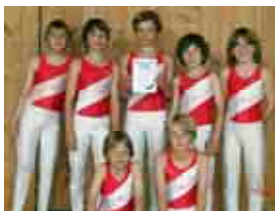
Bayernpokal Buben AK 10/11