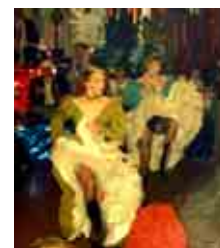
CANCAN 1988 ...fast wie von Toulouse Lautrec